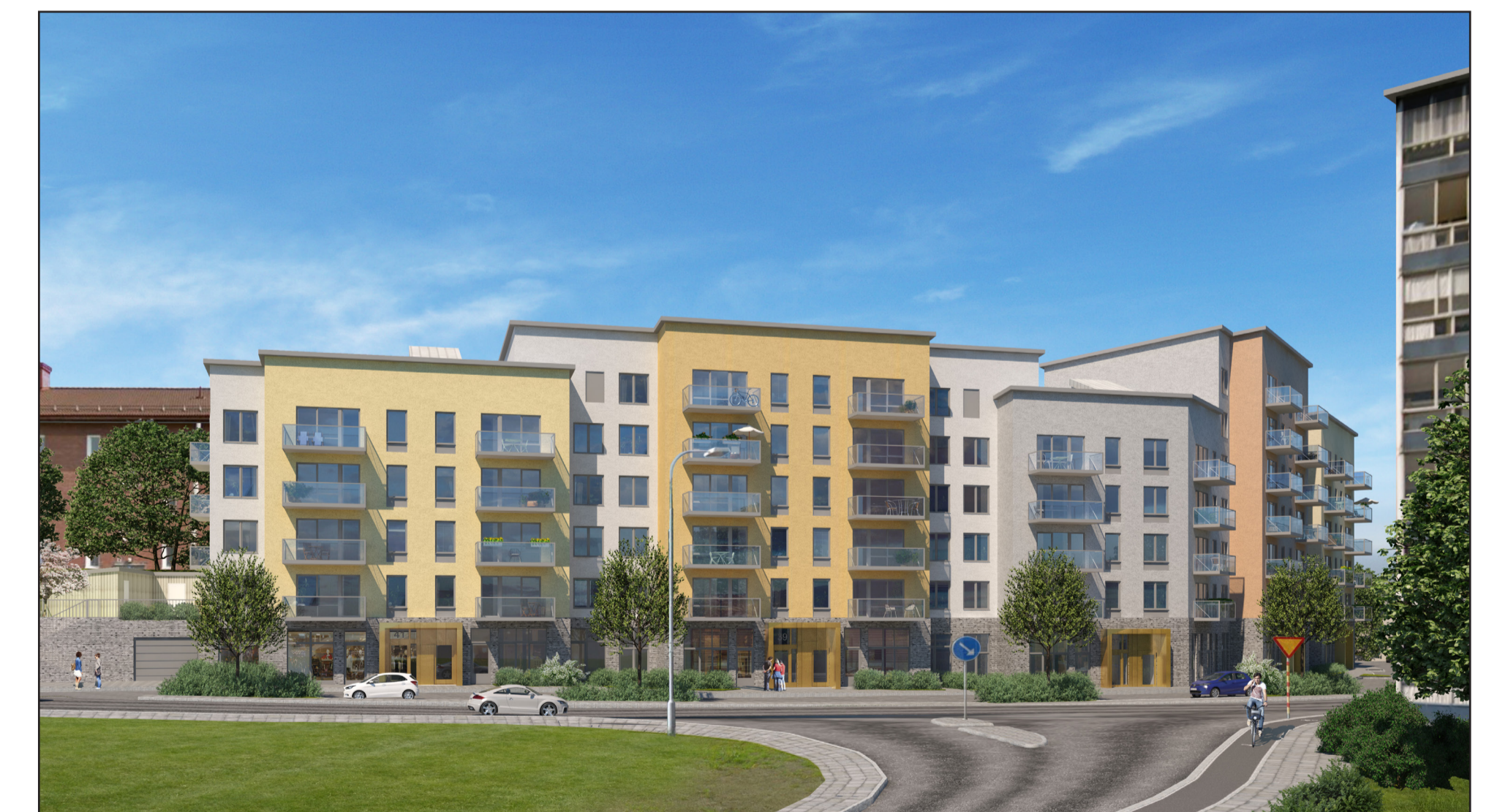
Perspektiv från Kapplandsgatan med illustrerat bebyggelseförslag längs Högsbogatan.